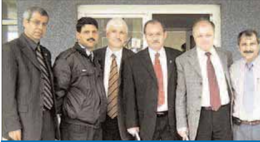
Türk YerelHizmet-Sen Genel Merkezi adım adım Karadeniz Bölgesini dolaşiyor

Bu nedenle belediyelerde görevli memurun belediye başkanlarının şahsi memuru olmadığı, 657 sayılı yasaya tabi olduğu görev ve sorumlulukları bu kanunda yazıldığı belirtilerek, memurların kadro görevlerinin haricinde çalıştırılmayacağı aksi halde başkanlarımızın sorumlu olacağı tüm belediye başkanlıklarına ilgili yetkili tarafından bildirilmiştir.