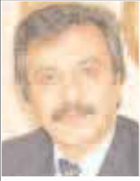
Türk Ulaşım-Sen Genel Sekreteri

mutlu hayat biçimini sunuyorduk. Çünkü atalarımız bilgili idi. Biliyorlardı ki; BİLGİ, üstünlüğü tartışılmayacak bir hikmettir ve ADAM olmanın alfabesidir. Bilgileriyle varlık dünyasını “NASIL ve NİÇİN” sorularıyla sorguladıkları için yaratılanı seviyorlardı, Yaratandan ötürü.